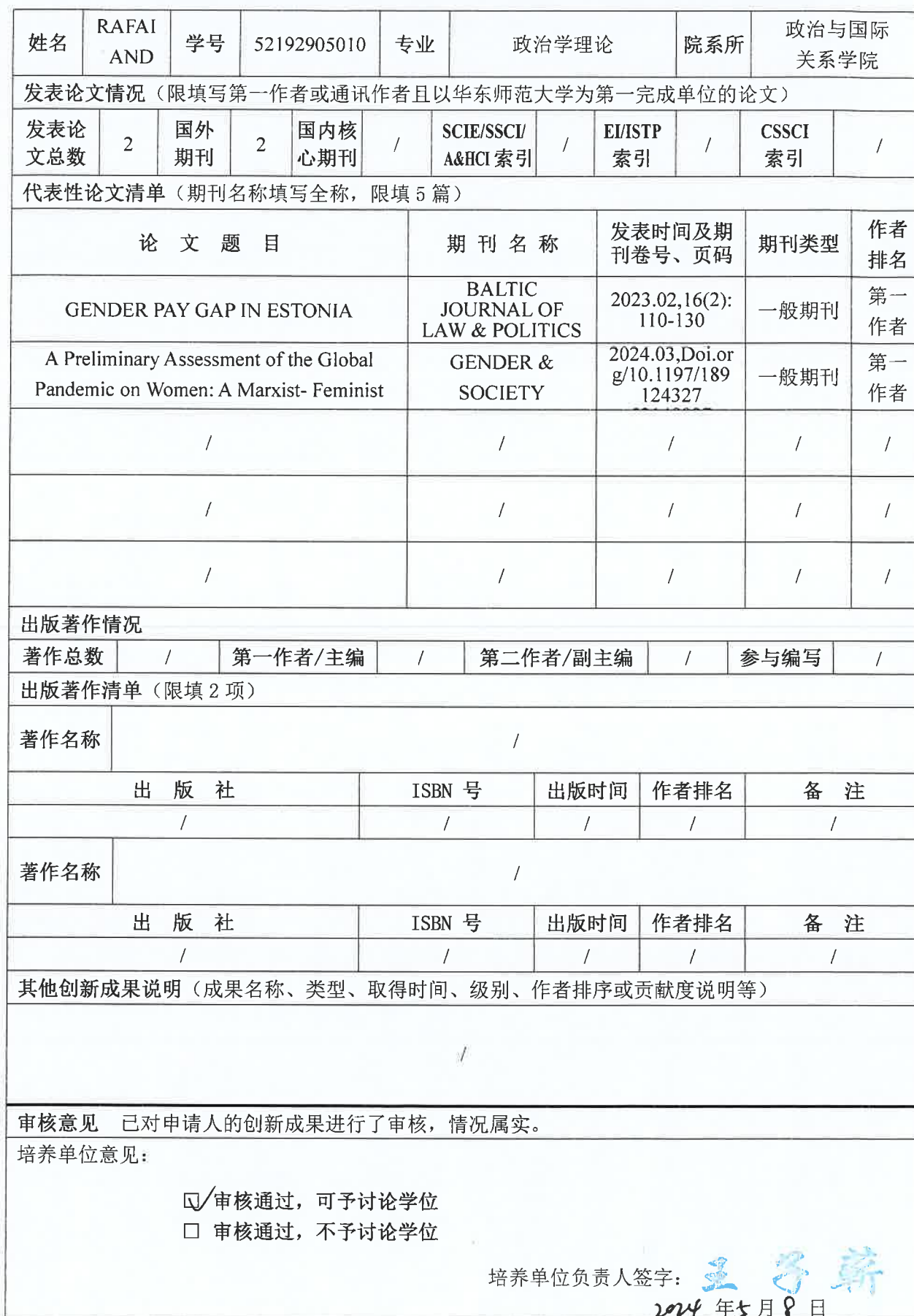
华东师范大学博士研究生在读期间创新成果信息表