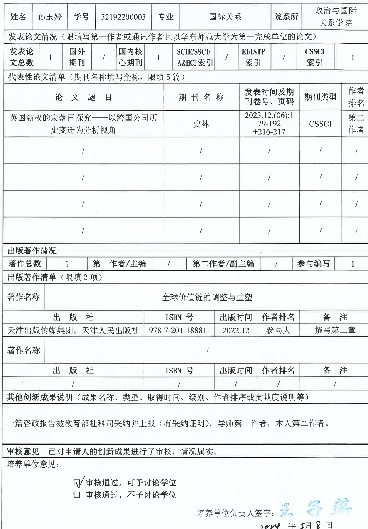
华东师范大学博士研究生在读期间创新成果信息表