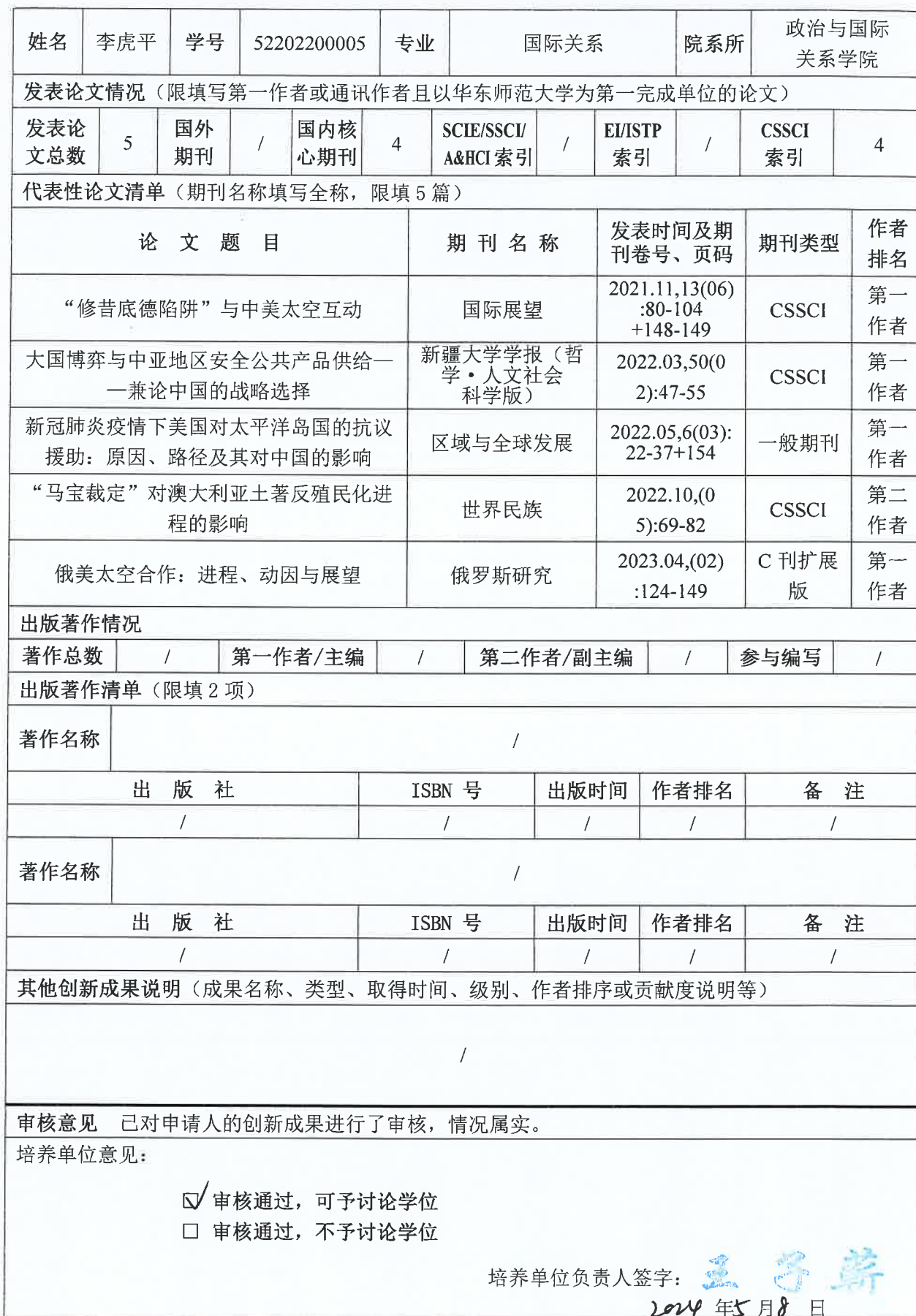
华东师范大学博士研究生在读期间创新成果信息表